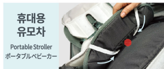
휴대용 유모차 Portable Stroller ポータブルベビーカー

유모차 프레임 뒤로 돌려 고정해주세요. / Surround the belts to the back of the stroller. / ベビーカー フレームの後ろに回し、固定してください。